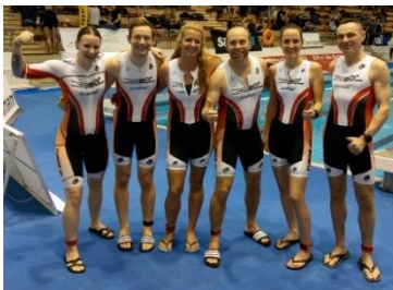
Erfolgreiches Debüt, Indoorman in Rostock

Wir bleiben uns treu und auch 2019 kann Jedermann und jede Frau, jedes Ziel mit uns angehen. Die Trainingsorte sind unverändert. Fragen bitte an fitness@tvb09.de